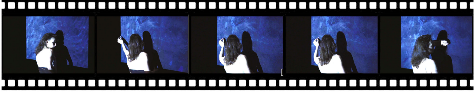
Ode Maritime - Compagnie Accidens